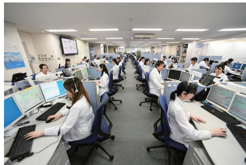
※コンタクトセンター(上野) 上野・新宿・名古屋・大阪の計4拠点および当社指定の場所で 相談対応を行っております。